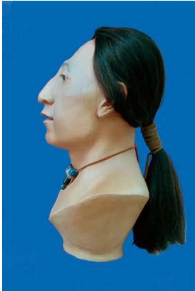
Versión final norma lateral